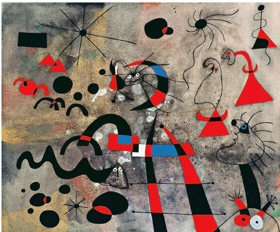
JUAN MIRÒ, "LA SCALA DELLA FUGA"